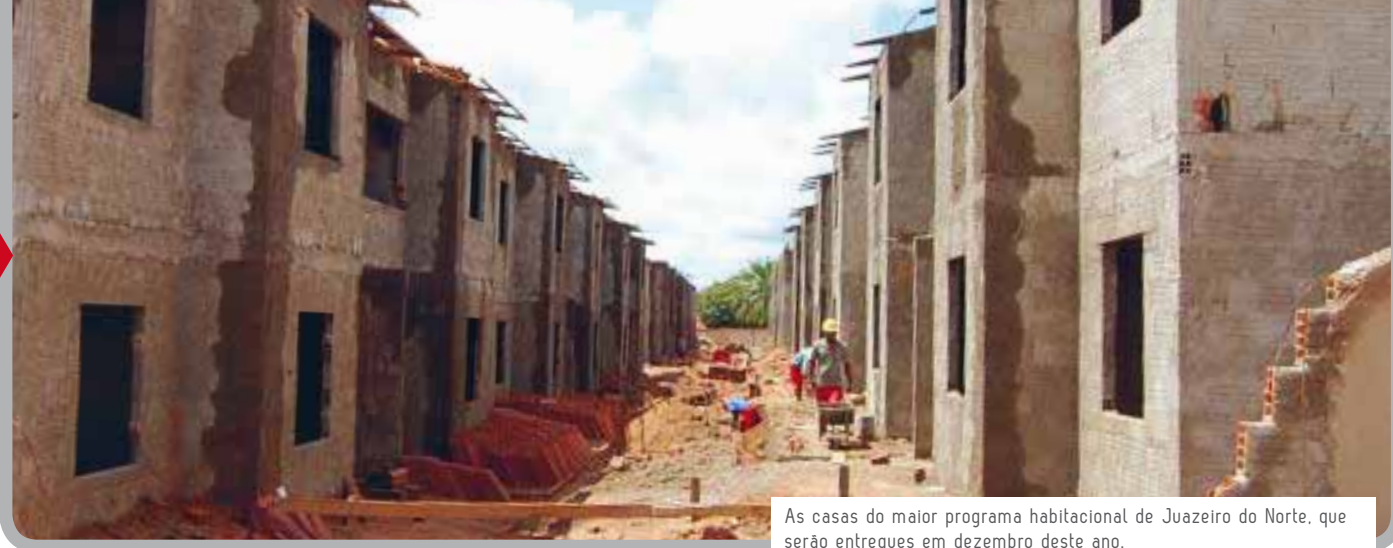
As casas do maior programa habitacional de Juazeiro do Norte, que serão entregues em dezembro deste ano.